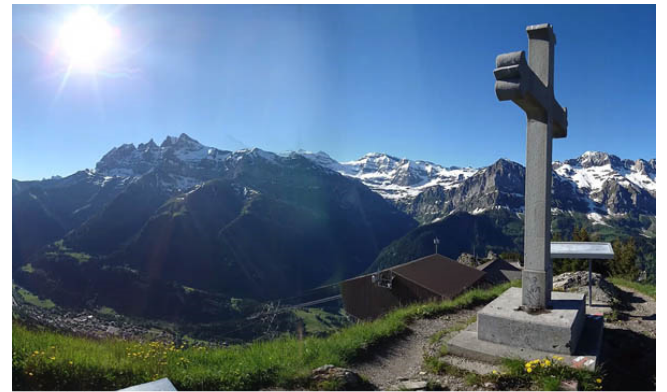
Croix du Culet