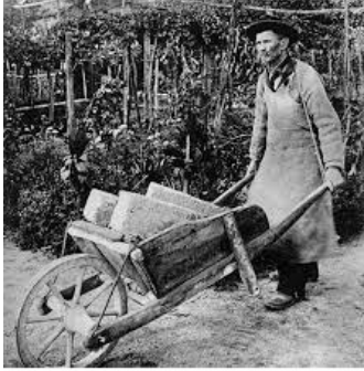
Le facteur Cheval et sa brouette

D'abord j'aimerais remercier les participants à la dernière sortie d'automne pour leurs encouragements à continuer à vous écrire chaque trimestre.