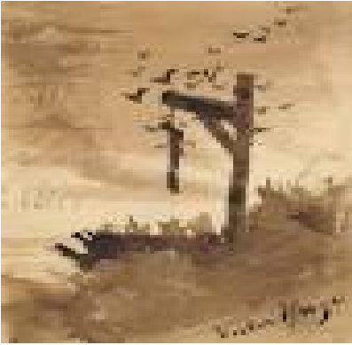
Illustration de la « Ballade des Pendus » par Victor Hugo